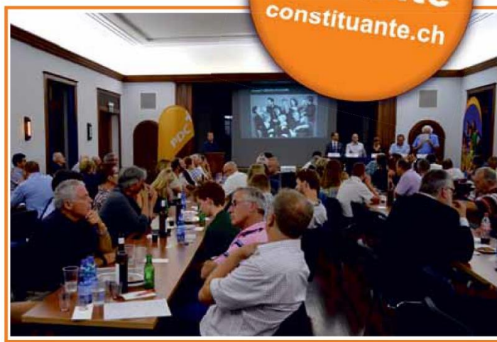
Mercredi 29 août 2018, soirée de présentation des 17 candidats du PDC du district de Sierre. Différents et unis!

Alors, dans cet exercice, ouvrons l'œil et le bon, élistons des personnes compétentes qui vont rédiger. Rédiger, triturer les mots pour trouver la formule qui fédère. Cela présuppose que les rédactrices et rédacteurs aient un enracinement et des balises car notre beau Valais est trop précieux pour l'exposer aux aventuriers des pensées extrêmes. Quand le litige devient aigu, le pouvoir judiciaire cherche dans la Constitution la réponse et à ce moment, il est trop tard pour gémir car on se